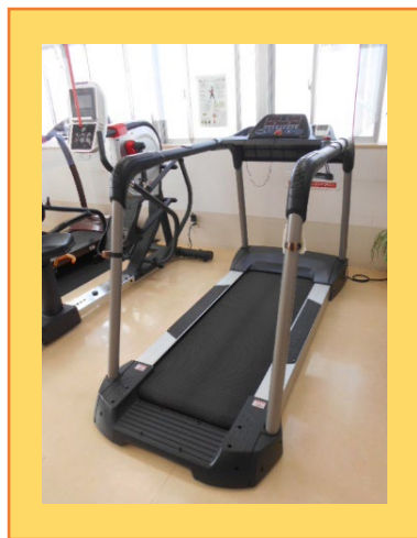
ウォーキングマシン