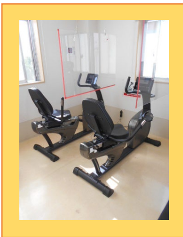
リカンベントバイク